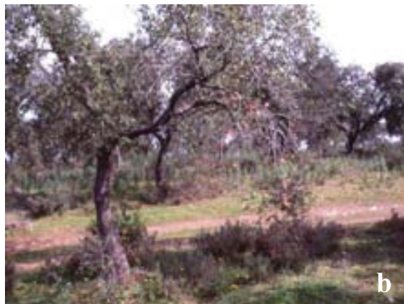
Figura 3. Chancros causados por Botryosphaeria spp. a) Lesión en tronco de alcornoque, b) Marchitez en ramas de encina.