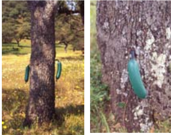
Figura 2. Tratamiento contra la podredumbre radical causada por Phytophthora cinnamomi mediante inyección al tronco de fungicidas específicos.

resistentes, así como en el uso de antagonistas, fundamentalmente micorrizas.