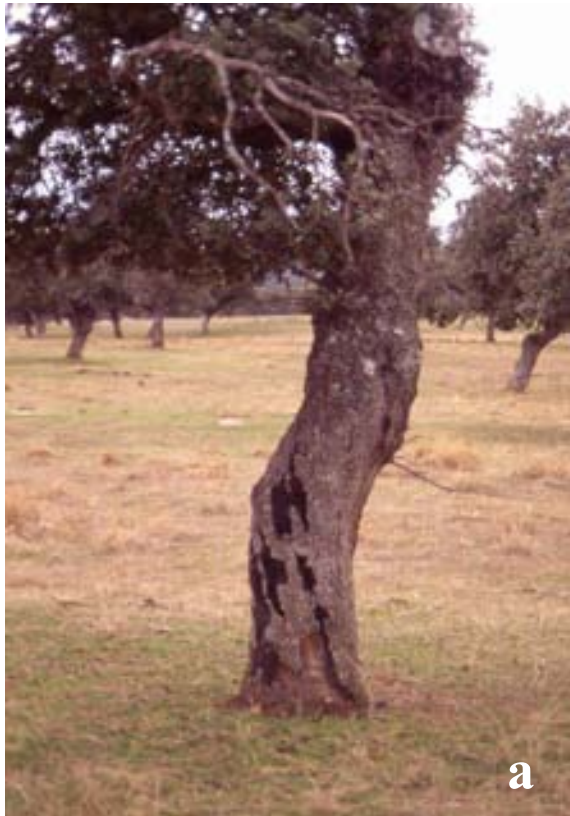
Figura 4. Chancro carbonoso causado por Biscogniauxia mediterranea . a) Carbón en tronco de encina, b) estroma carbonoso en rama de alcornoque.